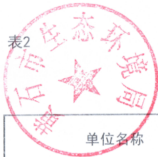
行政许可统计表 (2022年度)