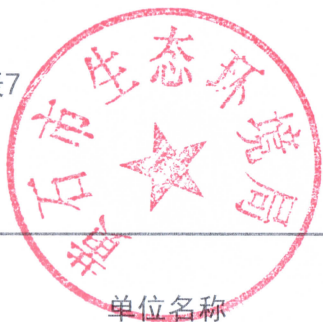
其他行政执法行为统计表 (2022年度)