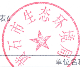
行政检查统计表 (2022年度)