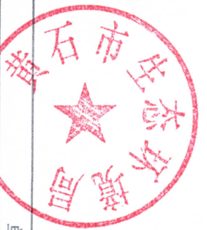
行政检查统计表 (2021年度)